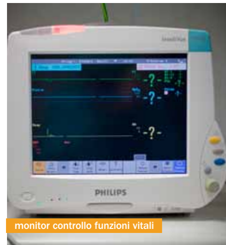
monitor controllo funzioni vitali

Il ricovero in Terapia Intensiva è necessario quando le funzioni vitali di un individuo diventano insufficienti al mantenimento della vita stessa: le funzioni vitali sono la